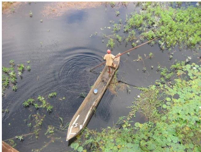
Pêcheur sur le fleuve Nyong au Cameroun.

L'objectif ultime de cette collaboration est de contribuer à une estimation plus précise du risque d'extinction de poissons d'eaux douces et saumâtres d'Afrique, afin d'établir des stratégies de conservation plus adaptées. En Afrique, la pêche en eau douce est essentielle pour des millions d'habitants et représente près de 2,5 millions de tonnes par an. L'information correcte concernant les espèces exploitées est donc d'une importance capitale afin de ne pas porter atteinte aussi bien aux besoins de base des communautés locales qu'à la riche biodiversité d'Afrique.