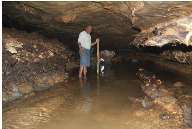
Une des grottes à proximité de Mbanza Ngungu (RDC) où l'on retrouve le barbeau aveugle.

Le MRAC s'efforce d'améliorer l'accessibilité de FishBase aux chercheurs et aux décideurs africains et d'en promouvoir l'existence auprès de ce groupe cible. C'est ainsi que depuis 2005 est organisé chaque année le stage 'FishBase et taxinomie des poissons', grâce au soutien de la Coopération belge au Développement (DGD). Au cours de ce stage de trois mois, cinq chercheurs africains ont l'occasion de découvrir les nombreuses facettes de FishBase et de renforcer leurs connaissances théoriques et pratiques sur la taxinomie des poissons. Le grand nombre de demandes de stage et l'évaluation positive des participants témoignent du succès de ce stage. Son importance est quant à elle démontrée par l'apparition d'un réseau professionnel étendu entre ex-stagiaires, leur institut de recherche et le MRAC, ainsi que par des initiatives locales qui diffusent les connaissances acquises pendant le stage. Par ailleurs, le MRAC a actualisé le site web FishBase for Africa ( www.fishbaseforafrica.org ) afin qu'il fonctionne comme plateforme centrale d'information pour ichtyologues africains. Enfin, le MRAC met en contact des ichtyologues africains avec FishBase, notamment via des colloques régionaux et la diffusion d'un DVD FishBase.