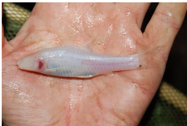
Caecobarbus geertsi est un poisson aveugle qui vit dans des grottes et qui est inscrit sur la liste d'espèces menacées de l'UICN. Cette espèce n'a été trouvée que dans les grottes à proximité de Mbanza Ngungu en République démocratique du Congo.

L'étude des poissons d'eaux douces et saumâtres d'Afrique constitue depuis la fondation du MRAC en 1898 un des aspects importants de la recherche scientifique au sein de l'institut. Au fil des ans, l'unité de recherche d'Ichtyologie du MRAC est devenue un groupe de recherche de renommée internationale et une autorité en ce qui concerne les poissons africains. Avec près d'un million de spécimens, elle dispose de la plus grande collection au monde de poissons d'eaux douces et saumâtres d'Afrique, ainsi que d'une bibliothèque spécialisée unique. Tout ceci est le résultat des recherches menées par plusieurs générations d'ichtyologues passionnés. Ces derniers ont contribué – et contribuent toujours – à élargir l'expertise et les connaissances du MRAC sur les poissons africains. Ce trésor d'information ne reste cependant pas cloisonné au musée puisque le MRAC prend diverses initiatives afin de le diffuser internationalement et de le mettre à disposition de tous.