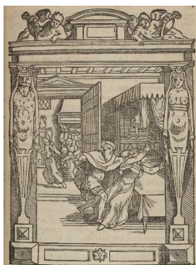
"De ravissement" Joos de Damhouder, La Practique et enchrion des causes criminelles, Louvain, Wauters et Bathen, 1555, p. 203.