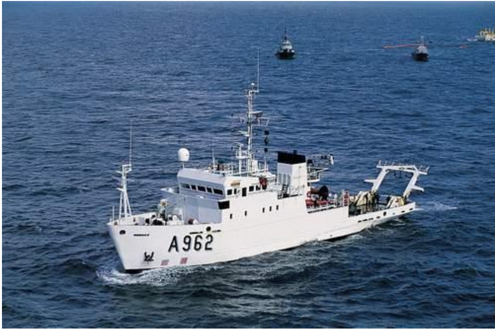
Het onderzoeksschip RV Belgica