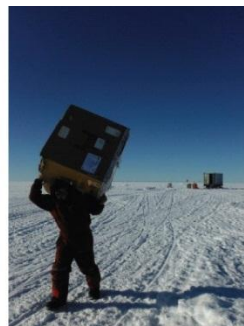
11. Veldwerk kan vrij zwaar zijn.