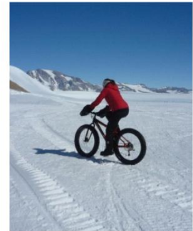
18. Een wetenschapper rijdt op een mountainbike speciaal ontworpen voor Antarctica.