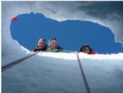
16. Wat bevindt zich in dat gat?