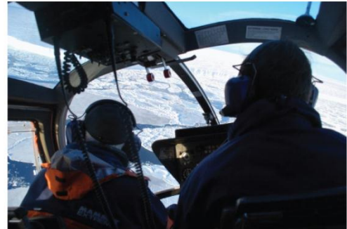
6. Deze wetenschappers worden via een helikopter van het schip Polarstern naar de Duitse basis Neumayer III gebracht.