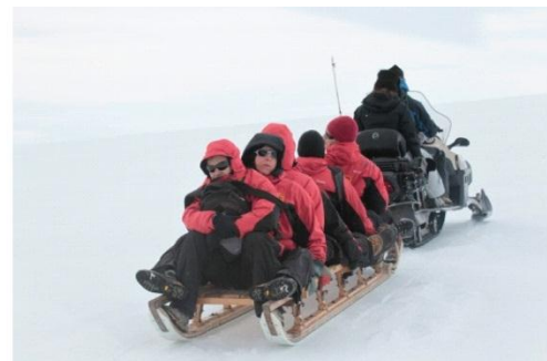
12. Wetenschappers worden vervoerd naar de top van een gletsjer op het Antarctica Schiereiland.