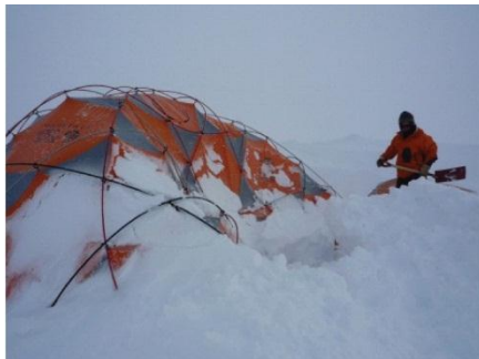
19. Een wetenschapper graaft zijn ingesneeuwde tent uit.