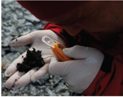
13. Een wetenschapper op zoek naar aanwijzingen.