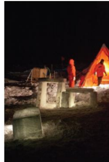
5. Winter duikkamp van het schip Polarstern.