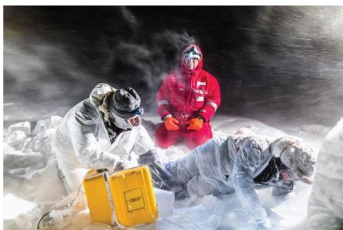
22. Stalen nemen gebeurt soms onder moeilijke omstandigheden.