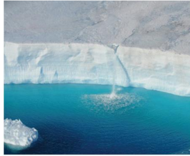
14. Waterval aan de rand van het ijsplateau dat zich uits trekt vanop het land tot in de zee.