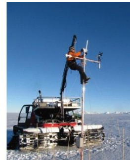
21. Installeren van een weerstation.