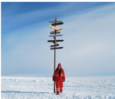
10. Een 'wegwijzer' illustreert hoe ver de Duitse basis Neumayer III op het Antarctica vasteland zich van de rest van de wereld bevindt.