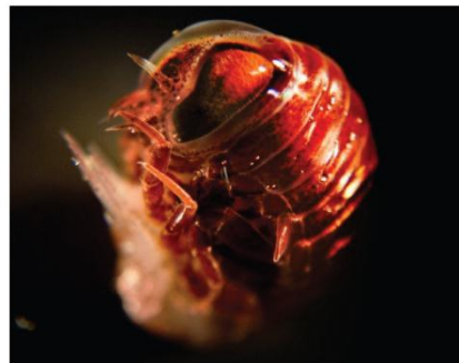
8. Mysterieus diertje van de micro-wereld.