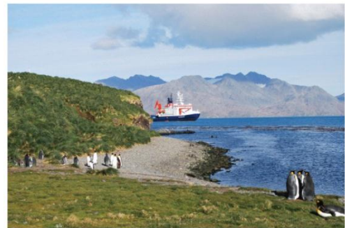
9. De bemanning van de Polarstern zegt hallo aan de pinguïns.