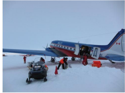
3. Lossen van een vliegtuig.