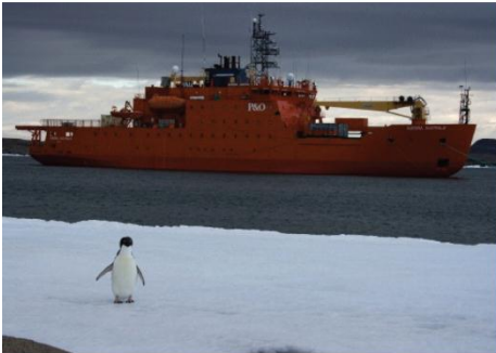
4. Onderzoeksschip Aurora Australis en Adélie Pinguïn bij Mawson Basis.