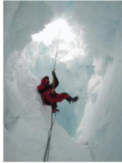
2. Spelonk training: omdat spelonken verraderlijk zijn, moet je zelf leren je weg te vinden.