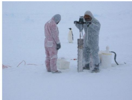
20. Wetenschappers boren in het ijs.