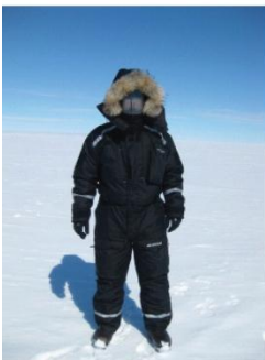
7. Goed uitgeruste wetenschapper.