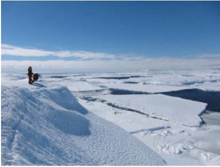
1. Wetenschappers observeren pinguïns op Antarctica.