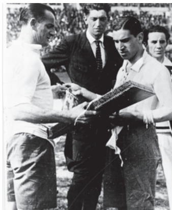
John Langenus (1891-1952) floot meer dan 80 internationale matches, waaronder de finale (Uruguay-Argentinië) van het eerste officiële wereldkampioenschap voetbal in 1930.