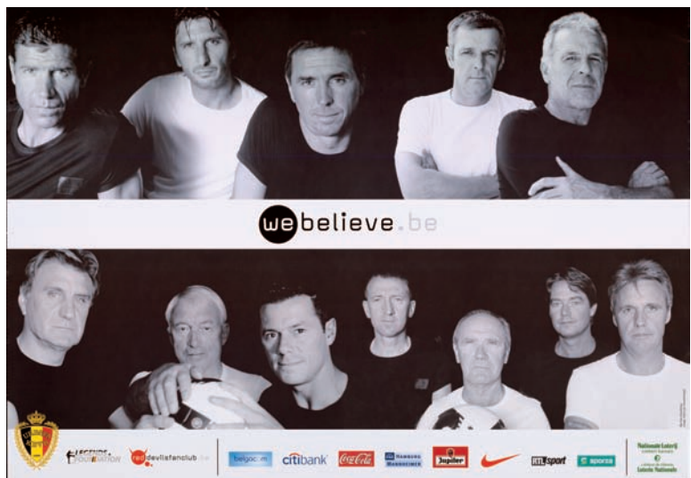
Als de resultaten tegenvallen, moet soccer nationalism soms wat aangemoedigd worden. N.a.v. het WK 2010 lanceerden de KBVB en de 'Legends Foundation' – succesvolle ex-internationals – een campagne om de Belgische voetbalsupporters opnieuw als één man/vrouw achter de Rode Duivels te krijgen.

En wat met de (oude) nieuwe Belgen? Een duidelijke gedragswijziging in supportersland tekent zich af. De modale allochtoon supportert steeds meer voor België, net zoals de modale autochtoon dit (terug meer) doet. Komt het omdat de Belgische nationale ploeg rock 'n roll-allures heeft gekregen? De kapsels van Fellaini en Witsel, de acties van Mertens en Hazard, de présence van Kompany? Bewondering, daar draait veel, zoniet alles, om in het voetbal.