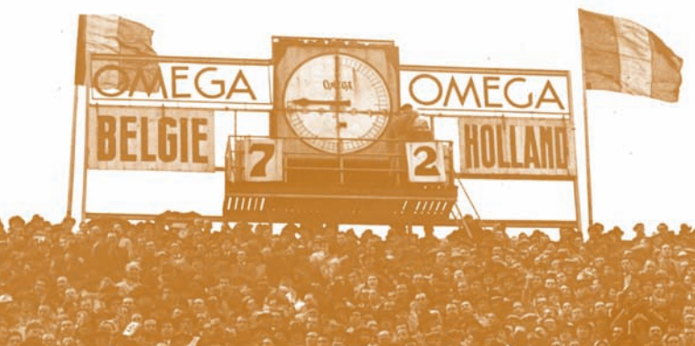
België-Nederland: 7-2, een historische vriendschappelijke interland uit 1950. Zo'n scorebord laat geen enkele Belg onberoerd!

Sporthistorici stellen dat glorieuze overwinningen een moment van eendracht en solidariteit kunnen veroorzaken: soccer nationalism . Deze cultivering van nationale identiteit, aangewakkerd door de media, doet latente maatschappelijke ongelijkheden eventjes vergeten. Dezelfde gezagsdragers die in tijden van mondialisering een hartstochtelijk pleidooi houden voor Europese samenwerking en solidariteit, zullen vrij schaamteloos nationalistisch argumenteren als het gaat over hun favoriete voetbalclub.