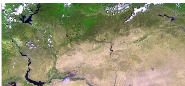
Sur cette image de Proba-V capturée le 28 mai dernier, soit trois semaines après son lancement dans l'espace, on observe une partie de la Turquie ainsi que le nord de la Syrie et de l'Irak. La vaste retenue d'eau sur l'Euphrate est bien visible sur la gauche. De même, les contrastes entre les zones cultivées et les régions arides sont saisissants.

En amont, la Politique Scientifique fédérale a également organisé une large consultation des utilisateurs potentiels de PROBA-V afin d'en définir le cahier de charges (International Users committee) et ce en collaboration avec la Commission européenne.