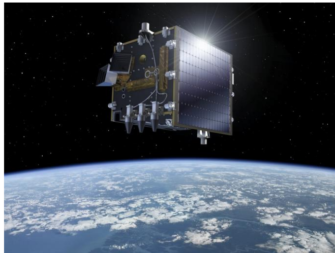
Le nouveau satellite d'observation de la Terre PROBA-V est "made in Belgium". Tout comme son instrument VEGETATION, il est de dimensions modestes. La plateforme a la taille d'une machine à laver tandis que l'instrument scientifique, qui affichait dans ses versions précédentes une masse de 160 kilos, est désormais miniaturisé. Il ne fait plus que 33 kilos et voit dans le même temps ses performances nettement améliorées.