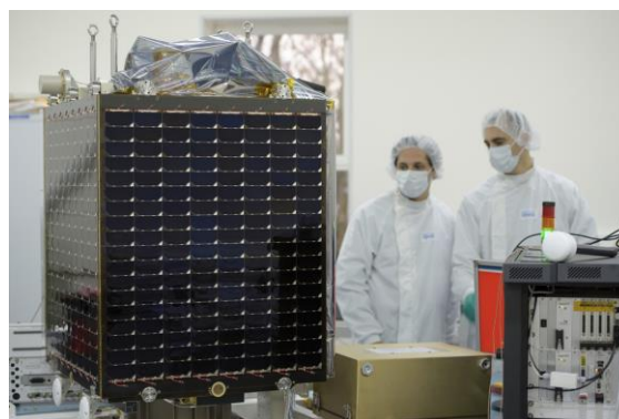
Quelques jours avant sa mise en orbite, au Centre guyanais de Kourou, le satellite Proba V est intégré sur le lanceur Vega.

La précision de la mise en orbite du satellite était en effet cruciale pour cette mission. PROBA-V ne dispose pas de moyens de propulsion propres pour rectifier sa course autour de la Terre. Une fois dans l'espace, il ne peut changer d'orbite, il est uniquement capable de rectifier son orientation. La mission du lanceur Vega, parfaitement réussie le 7 mai dernier, lui assure dès lors quasi cinq années de vie opérationnelle. Le temps d'attendre la mise en orbite de son successeur : le satellite d'observation de la Terre SENTINEL-3, de l'ESA et de la Commission européenne ?