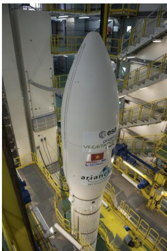
Le lanceur européen Vega est prêt pour sa seconde mission: le lancement en orbite de Proba-V et de deux charges utiles additionnelles. Il a décollé le 7 mai de Kourou.

Outre sa meilleure résolution et une géolocalisation plus précise des zones observées, un autre exploit technique relevé par les partenaires du projet porte sur la miniaturisation des technologies utilisées. Les deux premiers instruments VEGETATION présents sur les satellites Spot affichaient chacun une masse de 160 kilos. Celui sur PROBA-V ne fait que 33,3 kilos! En outre, l'instrument est désormais équipé d'une mémoire interne de 16 Gbytes, contre 2,5 dans les versions antérieures.