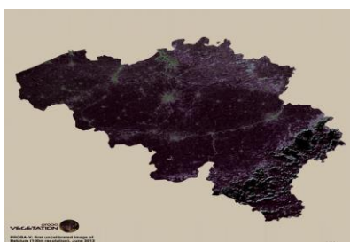
En juin, Proba-V avait déjà livré cette image de la Belgique sans nuage et avec une résolution au sol de 100 mètres. Une image "brute", obtenue avant la calibration de l'instrument VEGETATION.

En ce qui concerne la diffusion des données, il est à noter que celles à 1 km de résolution sont diffusées gratuitement à tous les utilisateurs sans distinction. Les données avec une précision d'1/3 de km sont par contre payantes lorsqu'elles sont récentes mais gratuites lorsqu'elles ont plus d'un mois. Les chercheurs travaillant en Belgique et au Luxembourg bénéficient d'un traitement spécial, puisqu'ils ont accès à toutes les données gratuitement.