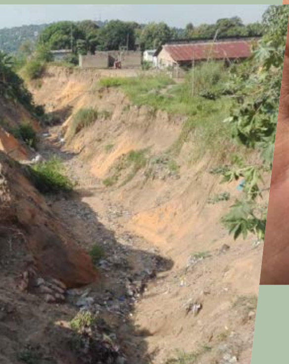
Bodemdegradatie in Kinshasa.

gevolge van de bouw van hydro-elektrische stuwdammen) als leefmilieufenomenen die het dagelijks leven sterk beïnvloeden. Deze fenomenen betekenen een aanzienlijk inkomensverlies voor de gezinnen die leven van de landbouw of de visvangst.