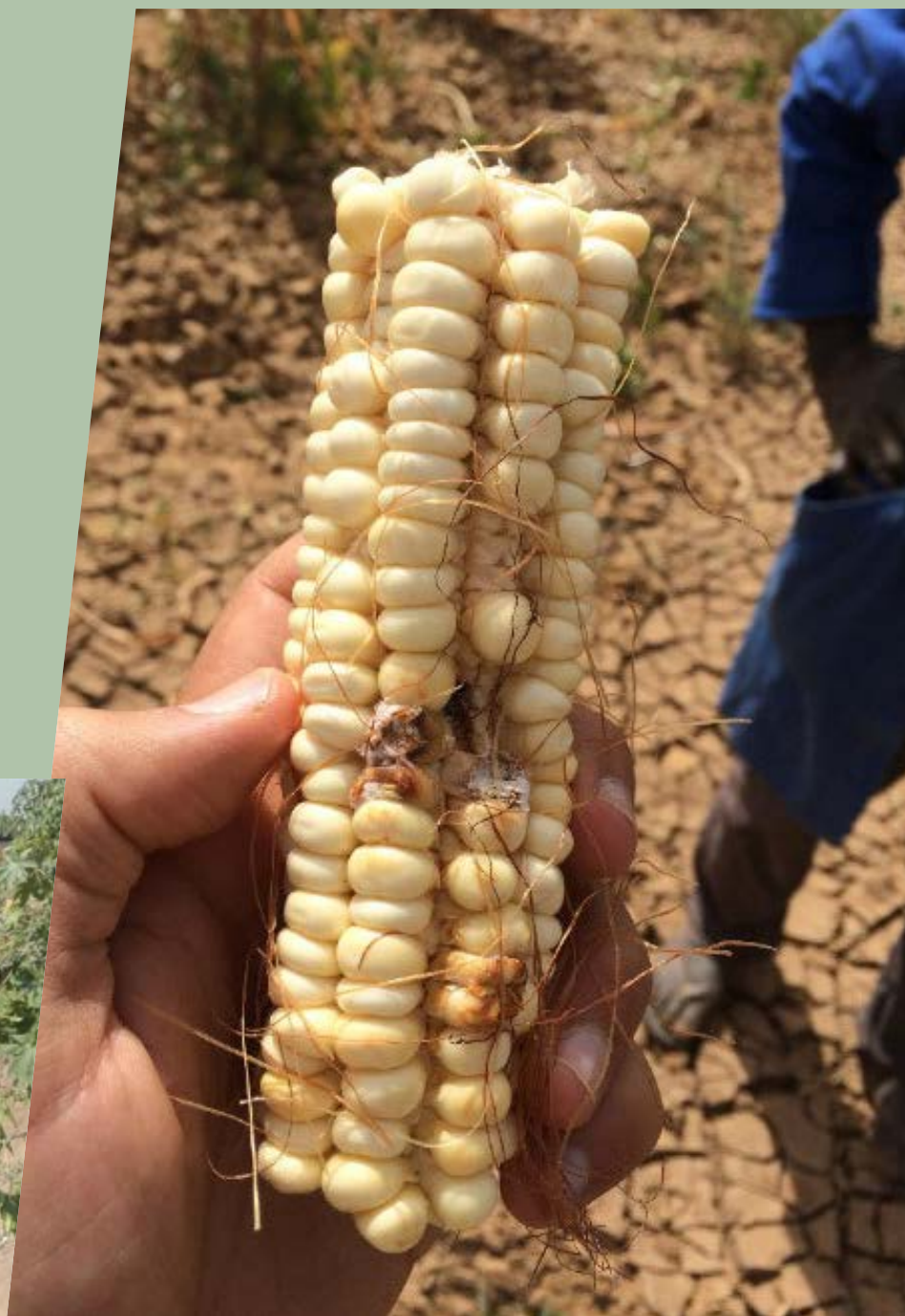
Verwoestijning heeft een impact op de maïsogst in de regio Matam (Senegal).