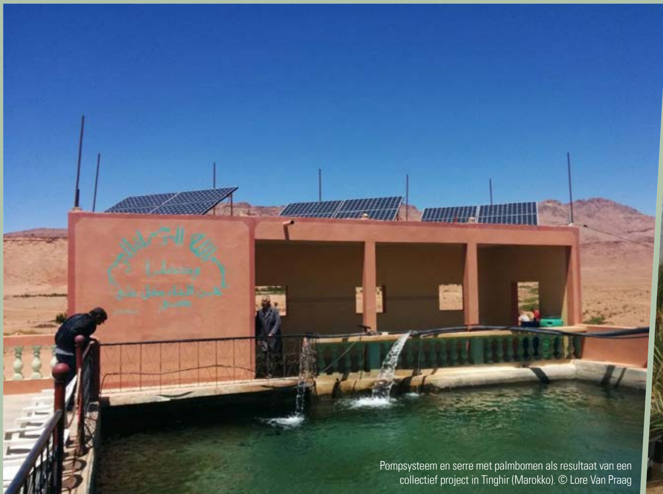
Pompsysteem en serre met palmbomen als resultaat van een collectief project in Tinghir (Marokko).

De kwestie van de niet-financiële returns - die overeenkomen met de immateriële voordelen van migratie zoals transfers van kennis en knowhow - is hier eveneens pertinent: sommige leden van de diaspora dragen bijvoorbeeld bij aan de verbetering van de veerkracht van hun gemeenschappen van oorsprong door het aanbrengen van nieuwe knowhow die soms vorm krijgt in een collectief engagement. In verschillende landen zagen aldus diverse samenwerkingsprojecten het licht die geïnitieerd werden door leden van de diaspora. Dat was het geval voor een project dat geleid werd door de 'Association Afanour pour le Développement à Tinghir' (in het Hoge Atlasgebied in Marokko). Leden van de diaspora die in hun land terug waren besloten om zonnepanelen te gebruiken om water op te pompen en het te bewaren in reservoirs om daarmee uitgedroogd weideland te irrigeren en er een bepaald type palmbomen te planten waarvan de dadels van een superieure kwaliteit zijn die tegen een hogere prijs kunnen verkocht worden. Zelfs indien de belangrijkste motivatie om dit project uit te voeren niet rechtstreeks gelinkt was aan de aanpassing aan klimaatveranderingen, droeg het initiatief nochtans bij aan de verbetering van de socio-economische situatie van de dorpsbewoners door de creatie van banen en van een toekomstperspectief voor de jongeren van Tinghir. Onrechtstreeks kan de lokale bevolking, dankzij dergelijke projecten, haar aanpassings- en reactiecapaciteit verhogen bij eventuele leefmilieuverstoringen.