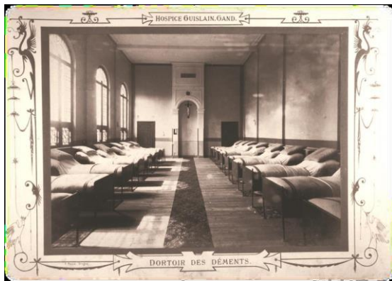
Gent, Hospice Guislain, Dortoir des déments, 1887

Het project zal een reeks van text mining en digitale linguïstische tools gebruiken met een focus op het historisch evoluerende gebruik van concepten, argumenten en discursieve strategieën. Specifieke computertoepassingen, in het bijzonder automatische information retrieval , zal het mogelijk maken om snel relevante onderwerpen en passages in een groot medisch corpus te detecteren voor verder nauwkeurig onderzoek. Aanvullende text mining bewerkingen zullen worden gecombineerd met een hermeneutische analyse van de geselecteerde passages.