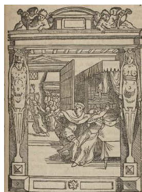
"De ravissement" Joos de Damhouder, La Practique et enchrindion des causes criminelles, Louvain, Wauters et Bathen, 1555, p. 203.