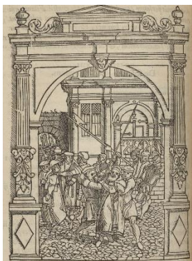
"Des seditions ou commotions" Joos de Damhouder, La Practique et enchrindion des causes criminelles, Louvain, Wauters et Bathen, 1555, p. 108.