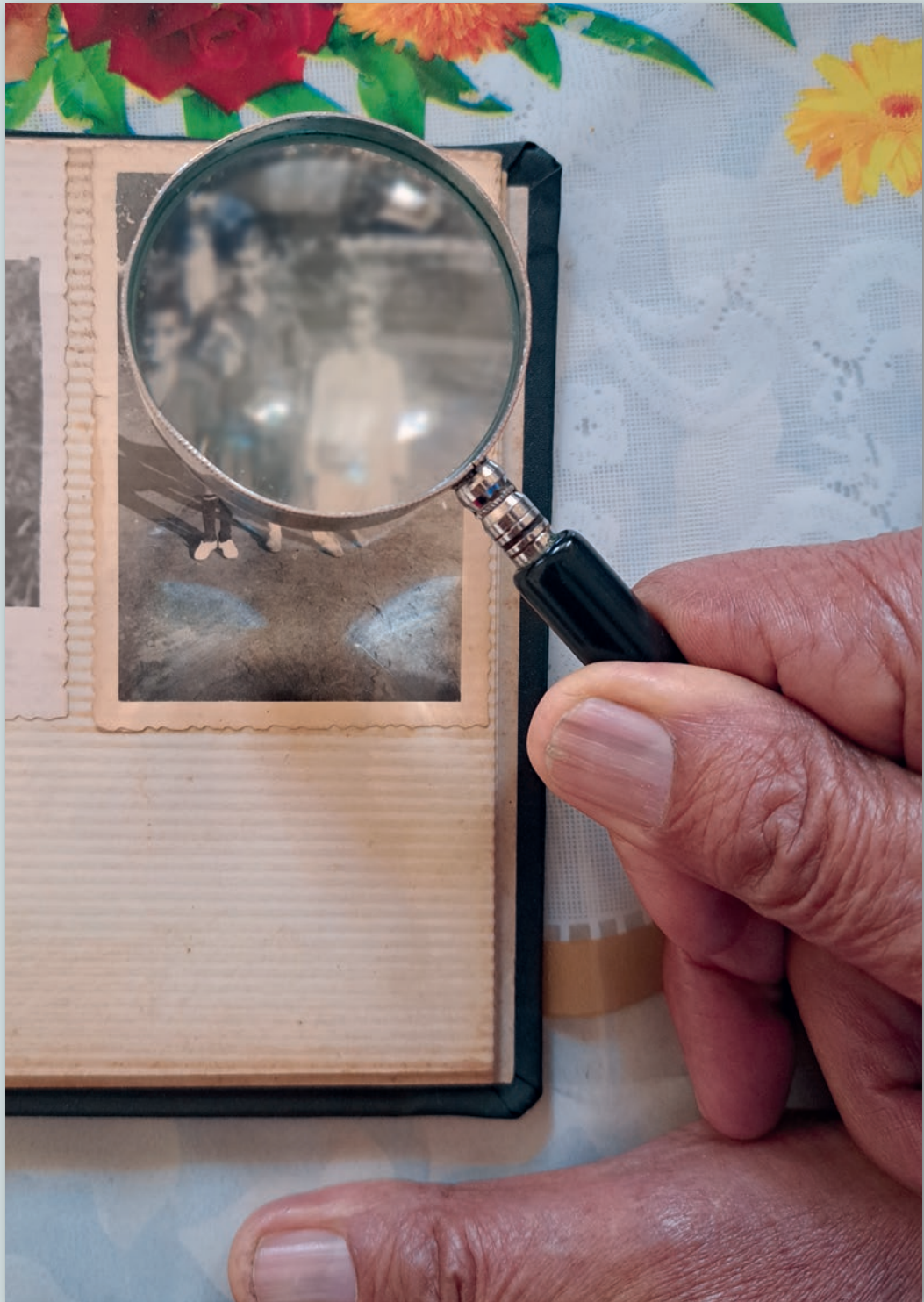
Bukavu, RDC, 2023