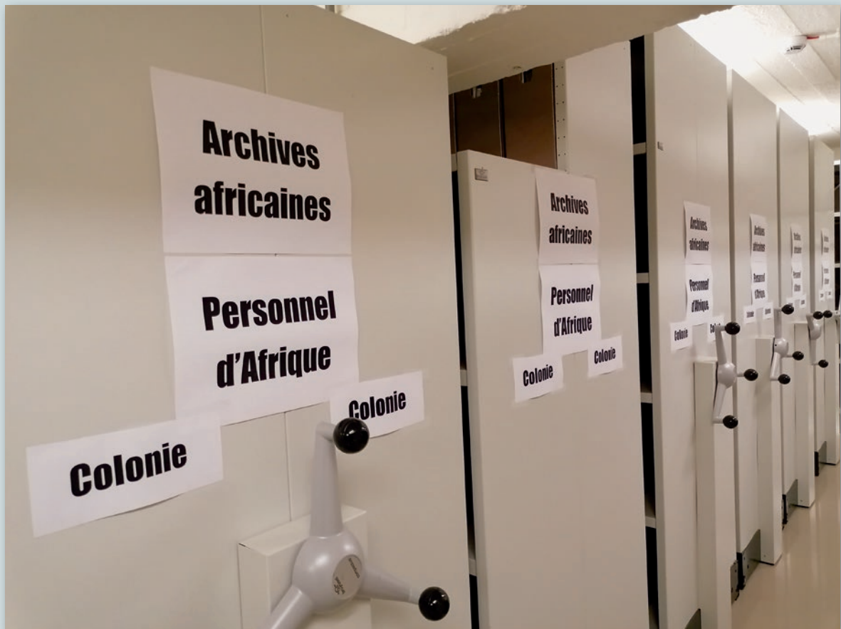
Rayonnages de dossiers individuels du Service du Personnel d'Afrique. AGR2 – Dépôt Joseph Cuvelier.