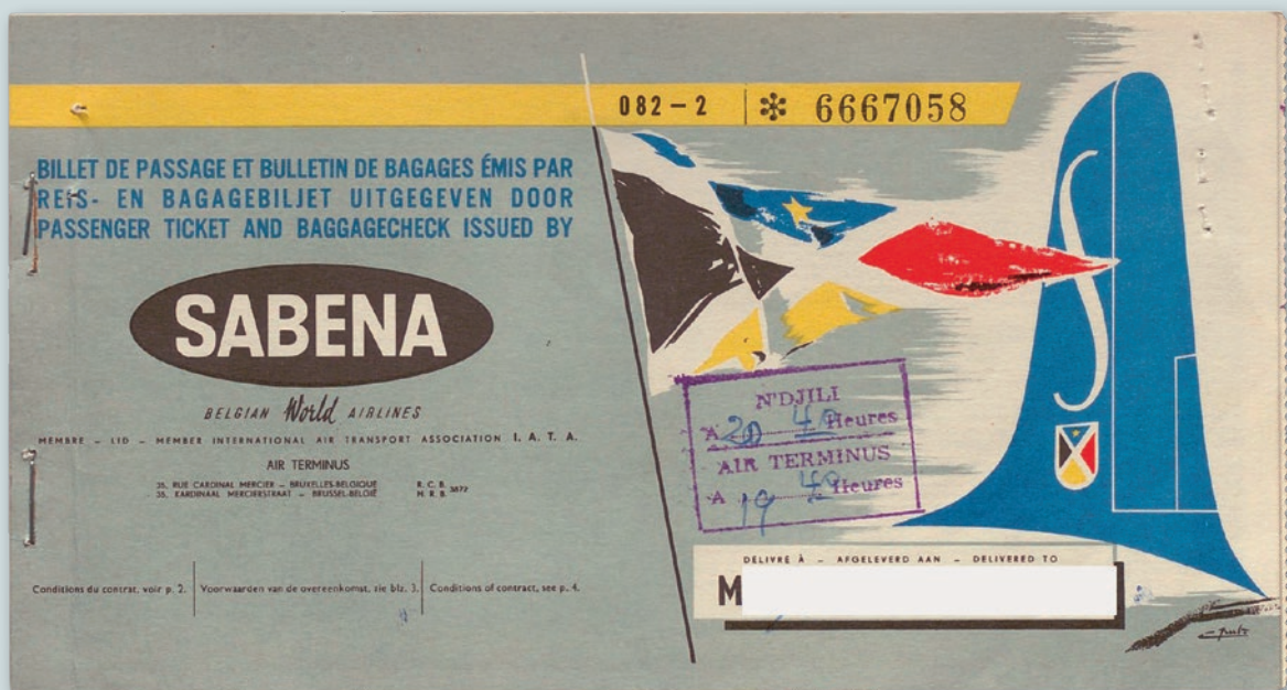
Billet d'avion d'une métisse lors de son transfert vers la Belgique, 1961.