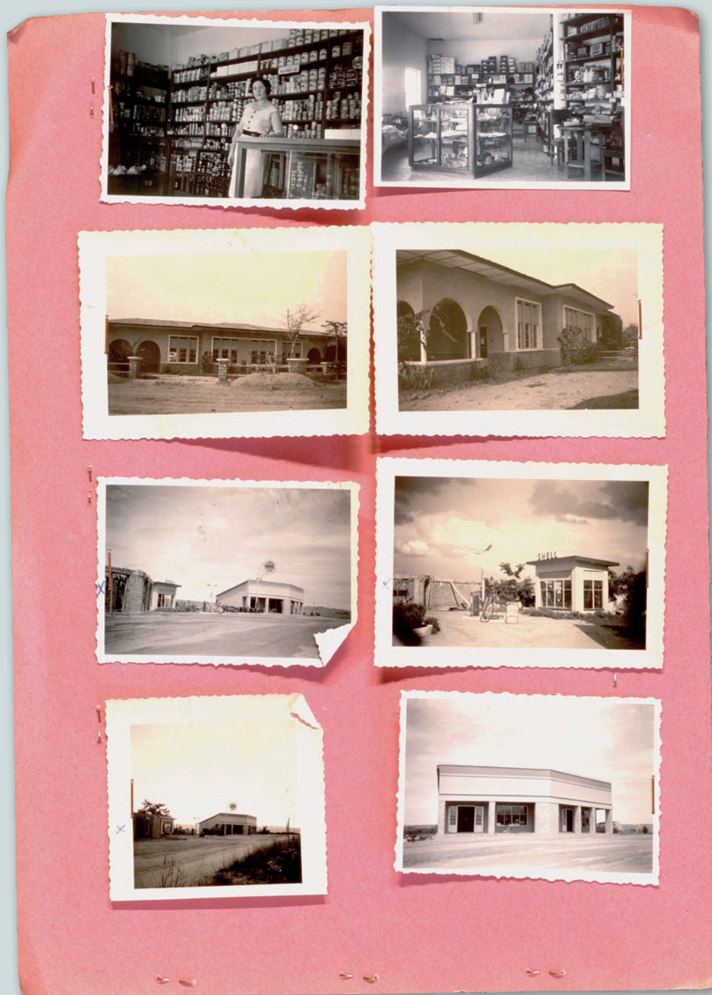
Photographies fournies par une sinistrée en vue de compléter son dossier de demande d'indemnisation [ca 1955]. AGR2 - Joseph Dépôt Cuvelier. Fonds Indemnisation Dommages Congo.