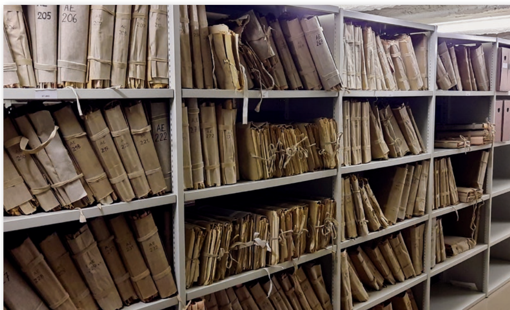
Rayonnage d'archives en attente de reconditionnement. AGR 2 – Dépôt Joseph Cuvelier.

riode coloniale se trouvant au Congo, Rwanda et Burundi, reste lacunaire. Il est cependant certain que des collections importantes et très pertinentes pour documenter l'histoire des métis y sont conservées. Auprès des paroisses, notamment, mais aussi auprès d'institutions qui ont à l'époque accueilli des métis, ou dans des institutions de conservation telles que l'INACO à Kinshasa. Sans prétendre à l'exhaustivité, des recherches seront menées dans les actuelles républiques du Congo, Rwanda et Burundi, afin d'y récolter à la fois des témoignages oraux (métis, familles de métis, acteurs historiques, etc.) et d'y explorer des archives papier. Vos avis et vos connaissances peuvent nous aider à identifier et sélectionner les lieux où nous effectueront ces recherches. Nous vous invitons donc à nous donner votre avis et à nous communiquer des informations relatives aux archives dont vous auriez connaissance sur place, toujours à l'adresse metis@arch.be .