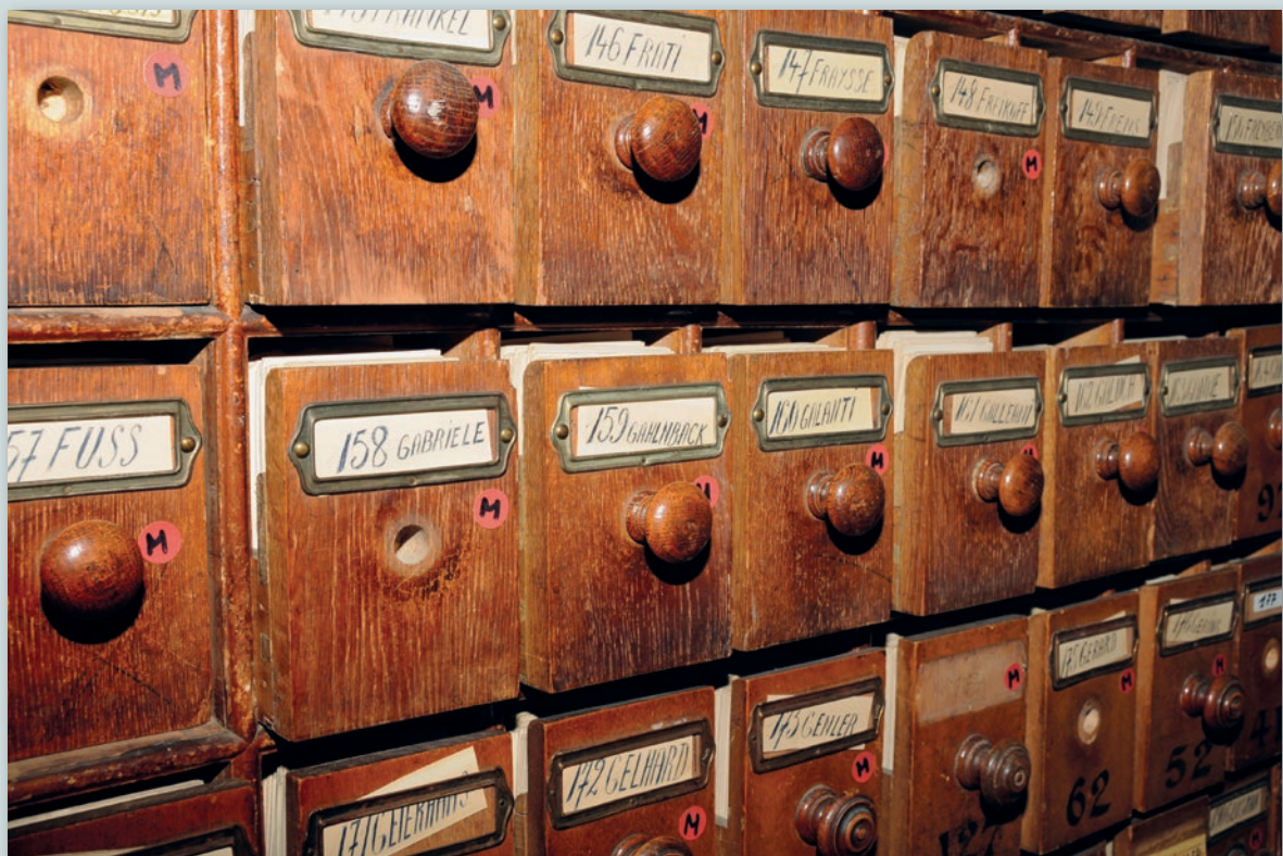
Fichiers originaux de la Police des étrangers, chaque fiche nominative renvoyant à un dossier individuel. Archives générales du Royaume 1.