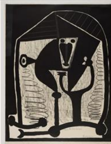
Pablo Picasso [1881 - 1973], Figure [1948] Musée national Picasso - Paris