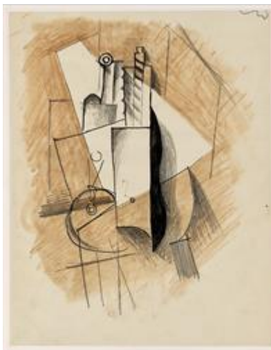
Pablo PICASSO [1881 - 1973], Projet pour une construction: guitare, bouteille et verre sur une table ronde [1933] Musée national Picasso - Paris