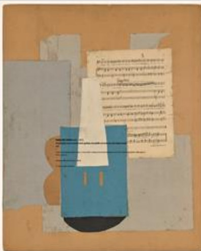
Pablo PICASSO [1881 - 1973], Violon et feuille de musique [1942] Musée national Picasso - Paris